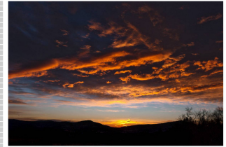
Das ist ein Glücksmoment, das ich nie vergesse. Ein Moment, das mich erinnert an meine Liebe zu mir selbst und an die Natur.