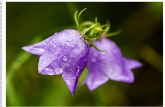
Das ist ein Glücksmoment, das ich nie vergesse. Ein Moment, das mich erinnert an meine Liebe zu mir selbst und an die Natur.