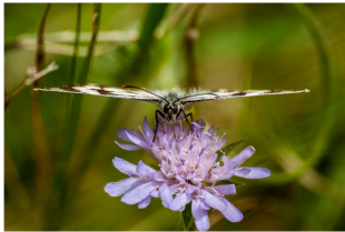
Das ist ein Glücksmoment, das ich nie vergesse. Ein Moment, das mich erinnert an meine Liebe zu mir selbst und an die Natur.