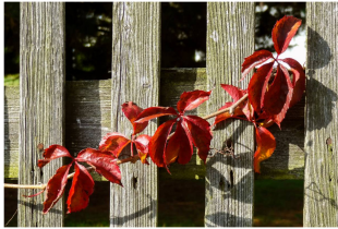
Das ist ein Glücksmoment, das ich nie vergesse. Ein Moment, das mich erinnert an meine Liebe zu mir selbst und an die Natur.