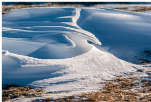
Winter, Schnee, Sonne und blauer Himmel. Das ist Glück und mehr noch. Das ist ein Glücksmoment, das ich nie vergesse.