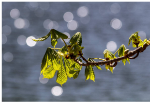
Das ist ein Glücksmoment, das ich nie vergesse. Ein Moment, das mich erinnert an meine Liebe zu mir selbst und an die Natur.