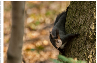
Das ist ein Glücksmoment, das ich nie vergesse. Ein Moment, das mich erinnert an meine Liebe zu mir selbst und an die Natur.