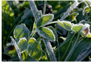
Das ist ein Glücksmoment, das ich nie vergesse. Ein Moment, das mich erinnert an meine Liebe zu mir selbst und an die Natur.