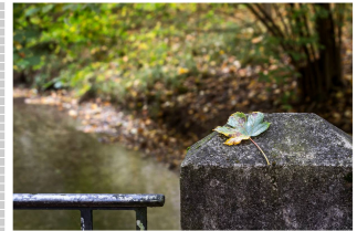
Das ist ein Glücksmoment, das ich nie vergesse. Ein Moment, das mich erinnert an meine Liebe zu mir selbst und an die Natur.