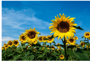
Das ist ein Glücksmoment, das ich nie vergesse. Ein Moment, das mich erinnert an meine Liebe zu mir selbst und an die Natur.