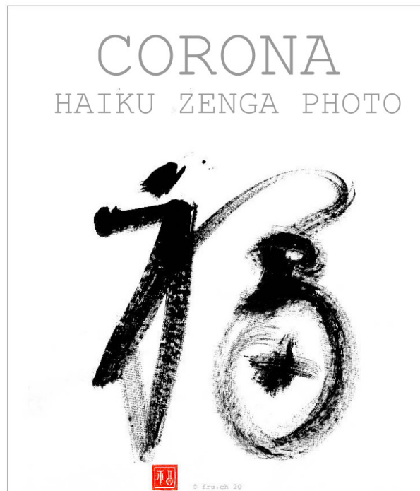
Altar und Gefäß stehen in einem Zeichen der Glückseligkeit.

Fru kombiniert Haiku, Fotografie und ostasiatische Tuschemalerei (Zenga) zu Themen und Ereignissen während der Corona Krise im Frühling 2020. Unter #vomfrudashaiku existieren dazu Filme auf youtube und Posts auf Facebook und Instagram. Bei epubli ist zu „CORONA HAIKU ZENGA PHOTO ein Kommentar erschienen.