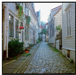
Altstadt Sandviken in Bergen Franz Hümpfner September 2023