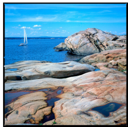
Skarvabåte auf Vesteroya Franz Hümpfner August 2023