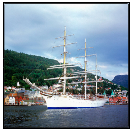
Skuttsentral Leikvicki in Bergen Franz Hümpfner April 2023