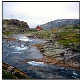
Klauvskjøttet im Nordland Franz Hümpfner Mai 2023