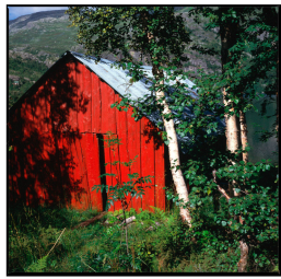
Fjellskene im Sørland Franz Hümpfner Oktober 2023