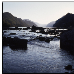
Hørgestemming im fjord Franz Hümpfner November 2023