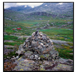
Im fjell bei Hallingselvdalen, Nordland Franz Hümpfner Februar 2023