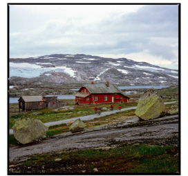
Westrethaus am Rallarvegen, Nordland Franz Hümpfner Juli 2023