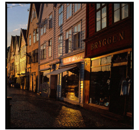
Bryggen in Bergen Franz Hümpfner Dezember 2023