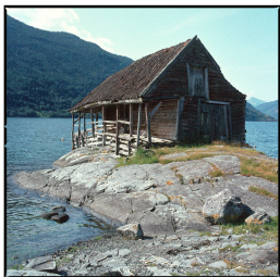
Hütte am Hofsvestvact Franz Hümpfner März 2023